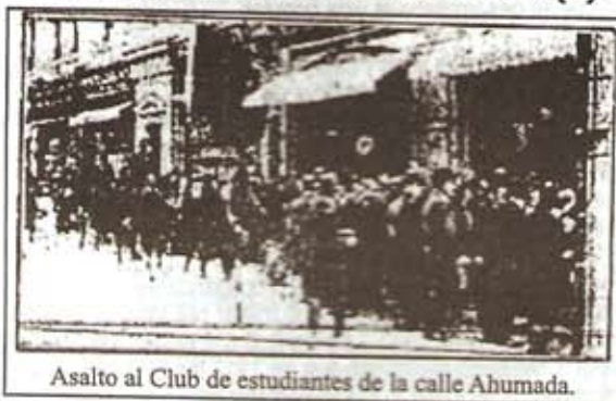
Asalto al Club de estudiantes de la calle Ahumada.

Luego de un par de años, el turno fue de Voltaire Argandoña y su pareja Hortensia Quinio, a quienes se les allanó