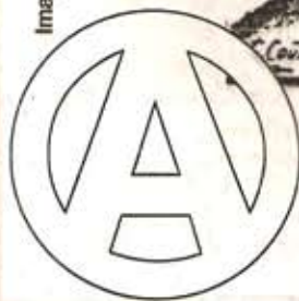
Imagen extraída del Periódico "La Batalla".

(Ateneo Popular de Mendoza, 1º de Mayo de 1930)